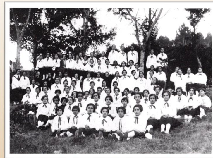
Fotografia a p&b: primeiras alunas (c. 1927-1930)